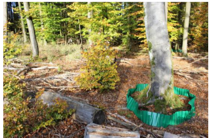
Herbst 2014: Zäune als "Maßnahme" gegen Krötensterben