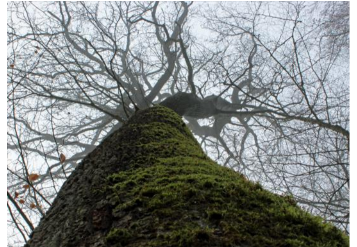
Über Jahrhunderte wurde das Ökosystem geschützt