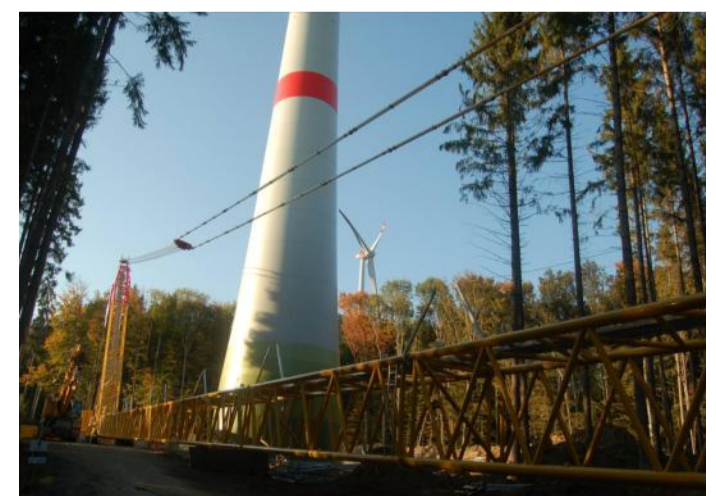
Sommer 2015: ohne Not in eine Industrielandschaft gewandelt