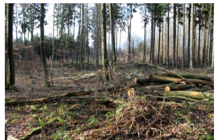
Frühjahr 2015: Sofortvollzug noch während der Einspruchsfrist